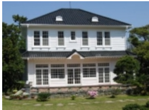
綺麗にお化粧直した外観

「過去に5〜6回、塗り替え工事を行っていると聞きましたが。どうして、こんな風に剥がれてしまうのでしょうか？」