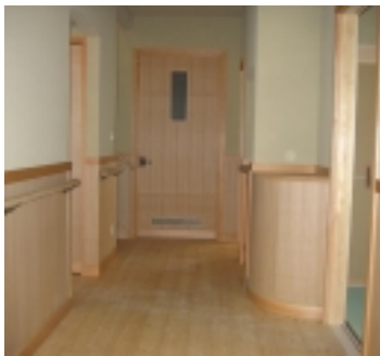
▲木のぬくもりが感じられる廊下。