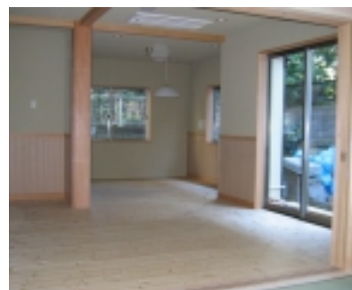
▲居心地の良いリビング。