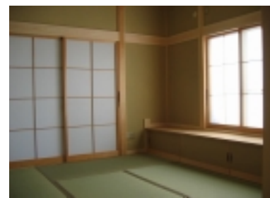
▲落ち着いた雰囲気のと室。

2004年日向建設では トトロの住む家 をテーマに 「家づくり」 を 考えていきたいと思ます