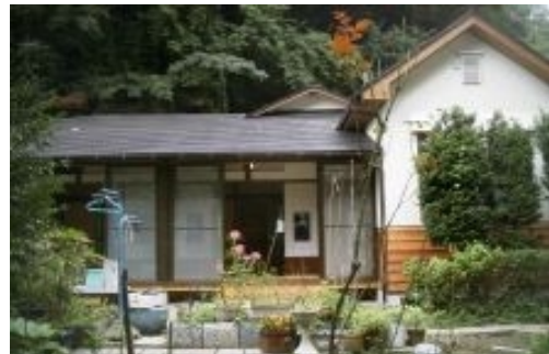
家の裏のどんぐりの木から、お庭にどんぐりがコロコロ落ちるので、通称「どんぐり荘」!

総合建設 株式会社 日向建設 ひゅうが せつ 〒247-0061 神奈川県鎌倉市 1-10-4 http://hyuuga.co.jp どこまでが夢ですか TEL 0467 (47) 5454 FAX 0467 (44) 0303