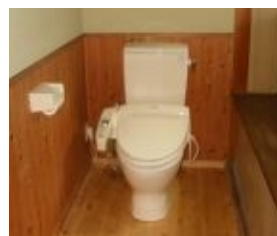
床はトイレまでバリアフリーの設計