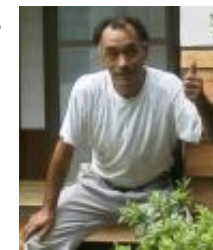
施主様をはじめ、関係者全員から大絶賛でした!