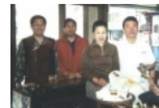
最右がかめやのご主人。となりが奥様、美人です！

「かめやのおまんじゅう」といえば、「保存料を一切使用しない手作りまんじゅう」として有名。毎年おみやげはここで買うと決めている日向建設ご一行様です。「亀屋さんは夫婦そろって『お、今年も来ましたね！』という感じで迎えてくれます。このお店は、饅頭作りのために“お水を美味しくする”独自の装置を使用しているんですが、その美味しい水を使って、主人が焼酎の水割りを作ってくれて、『今年も一杯やってく？』というんですよ。おまんじゅう屋さんなのに(笑)」。甘納豆と温泉饅頭をおみやげに買いました。