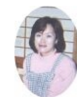
三四郎の女将さん。

『焼き鳥は追加一切できませんよ』って女将さんが言うから、なんて店だ！って思ったんだけど、出てきた焼き鳥をみてびっくり。バーベキューの肉みたいな大きさの、見たことない位大きな焼き鳥だった(笑)」。お店の主人もおかみさんもとっても粹な感じで、ここが大好きになり、毎年必ず行くようになったというお店です。