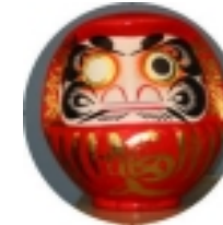
新しく事務所にやってきたダルマさんです。