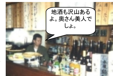
地酒も沢山あるよ。奥さん美人ですよ。

「毎年、お風呂に入ったあとに皆で必ず行く」というお決まりのお店。「5年ほど前にはじめて行ったとき、焼き鳥を頼んだら、