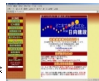
▲日向建設ホームページ http://hyuuga.co.jp

6月、梅雨の季節です。鎌倉マイホーム学院では、いよいよ3期生の講義が始まりました。場所は鎌倉芸術館、全7回の講義です。講師には各界のエキスパートを招き、家の基礎から内装インテリアコーディネートまで幅広く、楽しく、かつ専門的に学べます。ホームページ上でも、講義内容や受講生の声などが紹介されています。ぜひご覧下さいね！