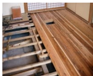
④丁寧に床を張り直す