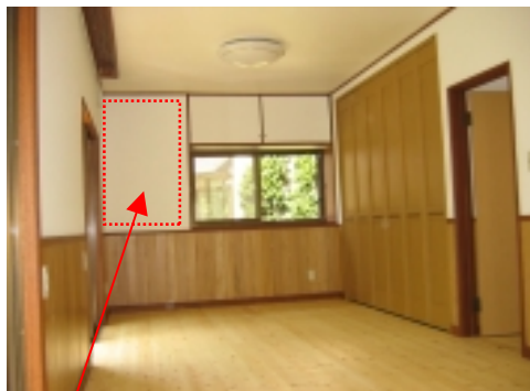
耐震補強もしっかりしました。耐震構造上、筋違いが必要な場所だったので、埋込み式の本棚はつづして壁にしました。

「楽しんで生活したいから、『快適に暮らす』ことに、とても関心を持っているのよ。だから、この家をリフォームするときには、今までの知識をいろいろと取り入れてみたいと思っていたの。生活していく上で、使い易さとか便利さを基準に選んだ製品を実際に使ってみたら、良かったですよ。」