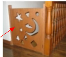
▲木の香りいっぱいの廊下

今回のリフォームも、Y様の提案を取り入れて工事をしました。こだわりの網戸と雨戸。洗面台は最新式の物。腰痛持ちの娘さんのためにとちょっと変わった洗面台を選んだそうです。