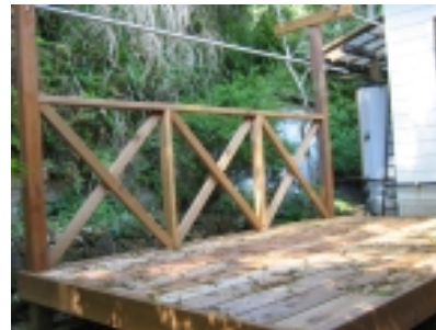
▲ウッドデッキの物干し場