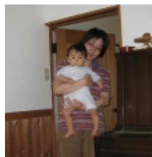
娘さんとお孫さん