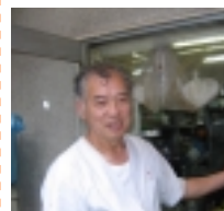
▲ご主人の作るラーメンのファン多